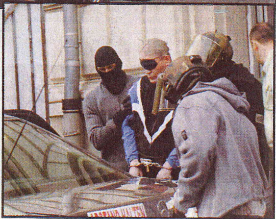
Der Prozess wurde unter höchsten Sicherheitsmaßnahmen geführt (l.). Die Bankräuber verprassten die Beute für heiße Frauen, coole Motorräder und schnelle Schlitten.